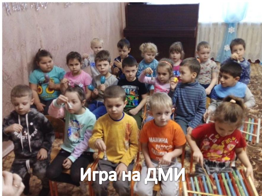
Игра на дМИ