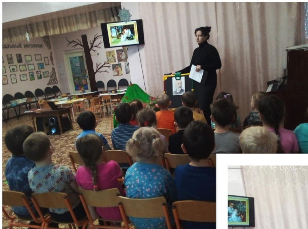
Слушание пьесы «Мама» П.И. Чайковского