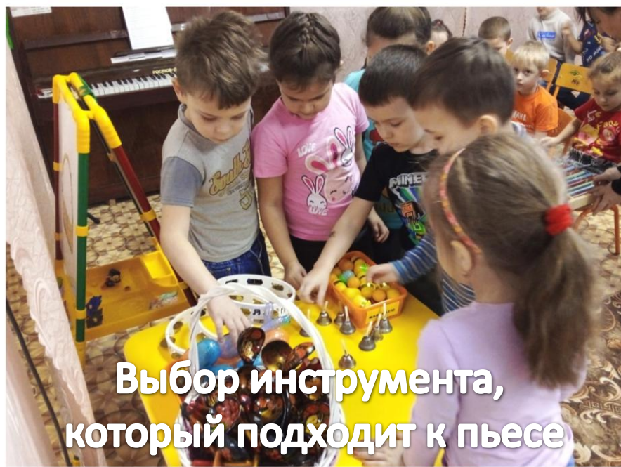
Выбор инструмента, который подходит к пьесе