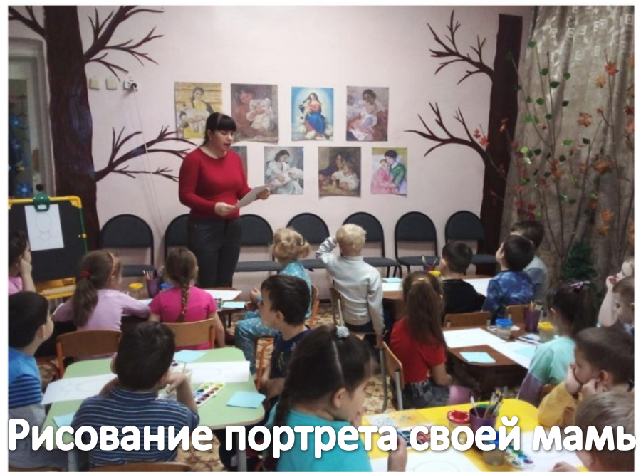
Рисование портрета своей мамы