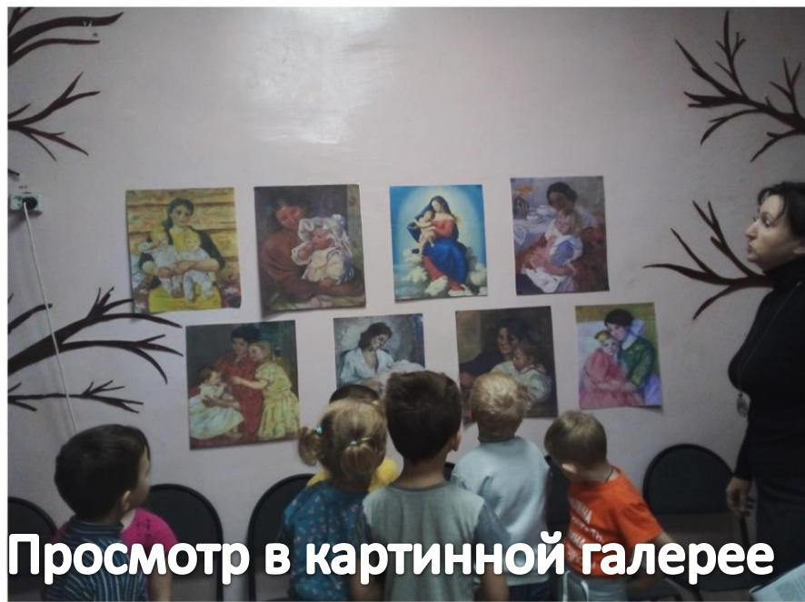
Просмотр в картинной галерее