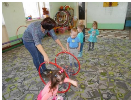
Игра: « У медведя во бору»