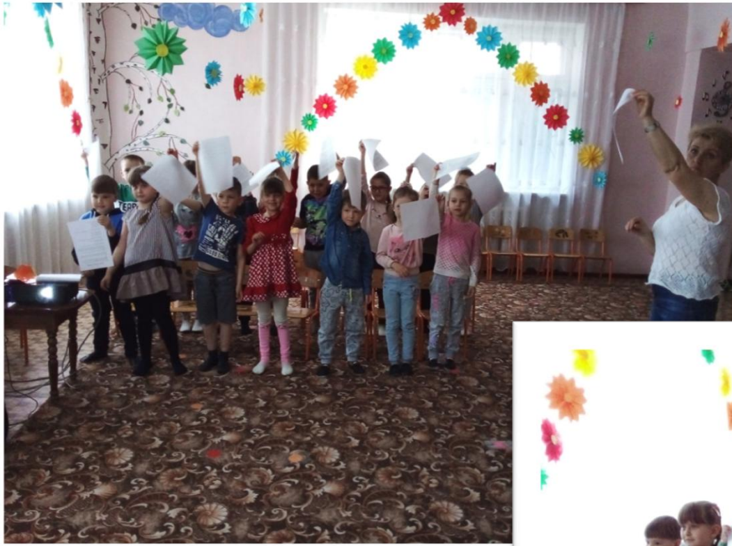
Игра в шумовом оркестре на бумаге