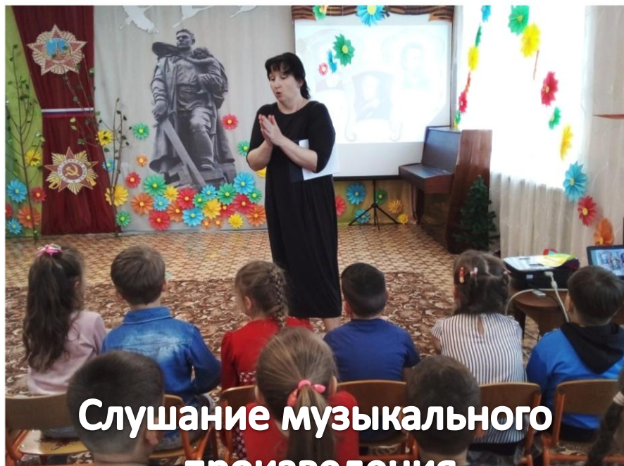
Слушание музыкального произведения