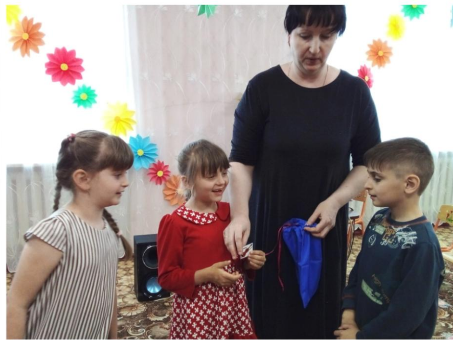
Игра «Волшебный мешочек»